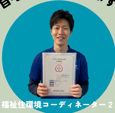
福祉住環境コーディネーター2級