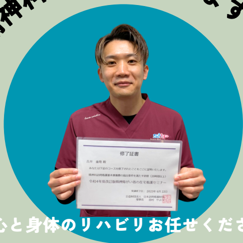
心と身体のリハビリお任せください